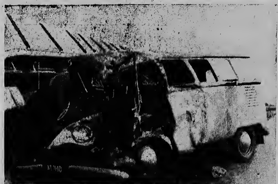
Dos hende a perde nan bida den cercania di Eisen. Un bus cu tabata bini for di direccion di Rijsen cu su chofer obrero procedente di Lemerterveld, a wordo primi ora el a trata na pasa un truck carga cu papel. Un auto di paseo cu tabata bini di direccion contrario a bin dal den nan. A muri e chauffeur di e bus y un ocupante. Dos otro a haya un shock. E foto ta duna un bista di e ravage.

HAVANA, 2 oct. — Segun noticianan cu ta circula na Havana, nan a condena e ultimo simannan aki, mas di 12 persona na Cuba, y nan a hanja strafnan di 27 te maximo 30 anja den prison, en conexon cu complotnan cu nan a planea contra regimen di prome minister Fidel Castro. E luna aki nan a sentencia por lo menos 80 persona.